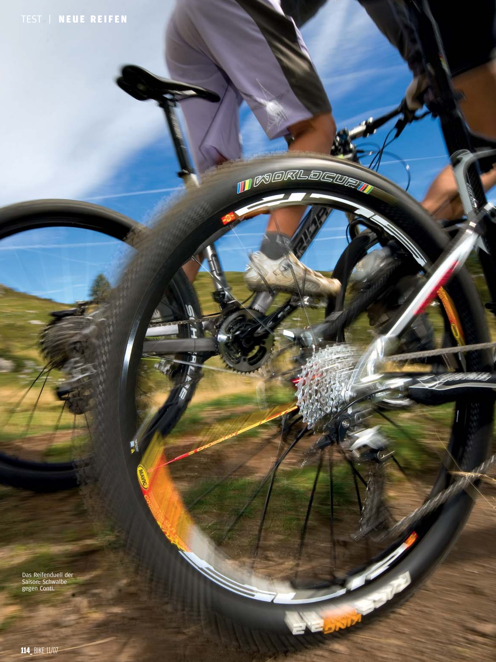
Das Reifenduell der Saison: Schwalbe gegen Conti.